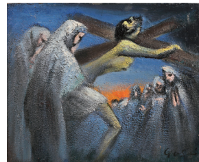
「キリスト」制作年代不詳 板・油彩 38.0×45.5cm 青森県立美術館蔵