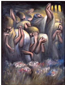
「インデオたちの祈り」1966年 板・油彩 (右)108.0×81.8cm (左)107.7×80.9cm 青森県立美術館蔵