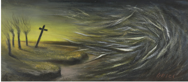
「前夜(太平洋戦争)」制作年代不詳 合板・油彩 59.2×136.0cm 世田谷美術館蔵