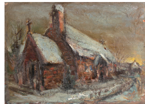
「シベリアの思い出」制作年代不詳 板・油彩 23.6×33.0cm 青森県立美術館蔵