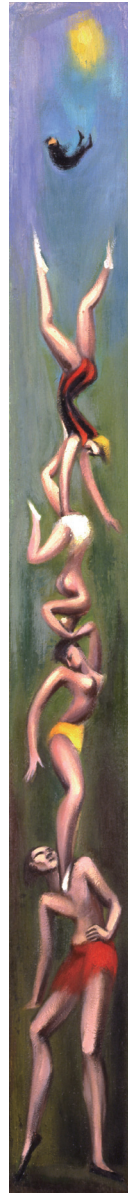
左「曲芸」制作年代不詳 板・油彩 183.2×20.0cm 青森県立美術館蔵

阿部合成(1910-1972)の生誕110年を記念して開催する本展は、青森県立美術館で開催する初の回顧展です。平成から令和にかけて、災害や疫病など、あらたな危機に直面しつつある今、東北と中央、戦争と人間といった日本近代の社会の矛盾に翻弄されながら、苦悩のなかに独自の芸術を追求した阿部合成の芸術の意義を改めて問い直します。