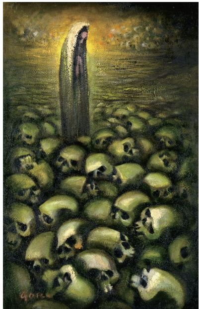
「マリヤ・声なき人々の群れA」1966年 板・油彩 92.2×56.1cm 青森県立美術館蔵