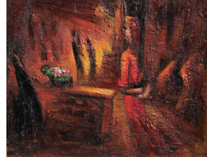
「よいどれ」1948年 板・油彩 51.7×65.0cm 青森県立美術館蔵