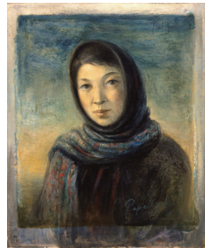
「夫人像」1942年 麻布・油彩 79.5×64.5cm 青森県立美術館蔵