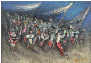
「ふるさとのおやまさんけい」1970年 合板・油彩 30.0×41.0cm 世田谷美術館蔵