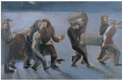
「小さき埋葬」1939年 板・油彩 46.0×65.0cm 栃木県立美術館蔵