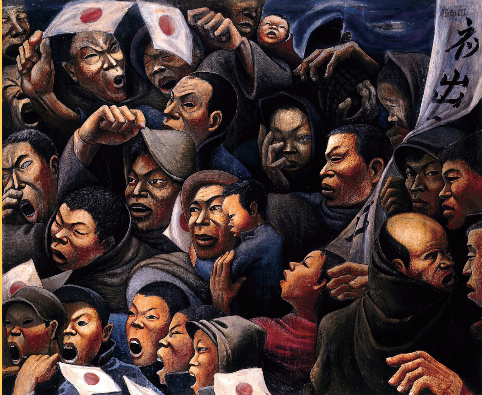
阿部合成「見送る人々」1938年 板・油彩 137.4×165.6cm 兵庫県立美術館蔵