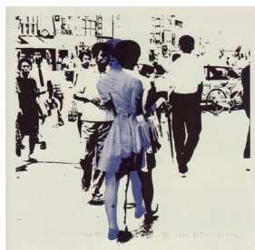
参考図版 吉田克明《work 9》 1970年 ユミコチバアソシエイツ蔵

県立美術館の設計者である青木淳氏が提唱した「原っぱ」論を参考に、展示室をはじめとする様々な個性的空間をそれぞれの「原っぱ」と見立て、館内外の至るところでアートを発見、鑑賞、体験できる場を設けることで、展示室だけでなく、美術館全体に大きな「つらなり」を生み出していきます。豊かな青い森の生態系のように空間や作品を連鎖、循環させることで、未来を切り開くための新しい活力を美術館全体に充満させていく試みです。