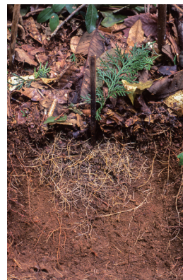
伊沢正名 「夏場の2ヶ月後、ウンコ分解後の養分を求めて、大量の木の根が野糞跡を覆う」撮影：9/13/07

県立美術館が地域に飛び出し、アーティストらとの協働のもと県内各地の魅力を発掘発信した「美術館堆肥化計画2021-23」の総成果展。アーティストに加え、現地で出会った福祉や地域振興、博物館構想といった自分なりのやり方で地域を耕す人びとを「堆肥者」として一律に捉え、コレクションや関連企画を交えて紹介します。美術館を、現実世界を生き抜く「生の下支え構造(リビング・インフラ)」に転化・拡充させる展覧会です。