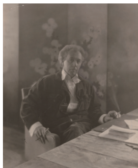
《フランク・ロイド・ライト、タリヤセンにて》

アメリカ近代建築の巨匠フランク・ロイド・ライト(1867-1959)。2012年にフランク・ロイド・ライト財団から5万点を超える資料がニューヨーク近代美術館とコロンビア大学エイヴリー建築美術図書館に移管され、建築はもちろんのこと、芸術、デザイン、著述、造園、教育、技術革新、都市計画に至るライトの広範な視野と知性を明らかにすべく調査研究が続けられてきました。こうした近年の研究成果を踏まえ、帝国ホテル二代目本館が1923年の竣工から100年を迎えるのを機に、多様な文化と交流し、先駆的な活動を展開したライトの活動を紹介する展覧会です。