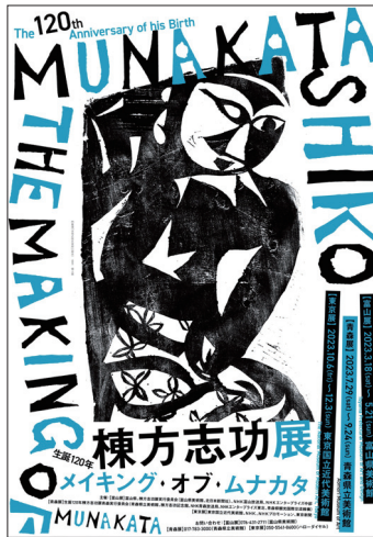
Poster for all three museums

Munakata Shiko (1903-1975) was a printmaker who achieved international acclaim, earning him the nickname “Munakata of the World.” His wholehearted devotion to his woodblocks remains etched within the memories of many. The three regions of Aomori, Tokyo, and Toyama, where Munakata lived or used as a base for his creation, were major influences on his development as an artist. To celebrate Munakata’s 120th birthday, museums in these three areas (Toyama Prefectural Museum of Art and Design, Aomori Museum of Art, National Museum of Modern Art, Tokyo) are holding this collaborative exhibition that focuses on Munakata’s relationship with each region and spans many fields such as woodblock prints, yamato-ga, and oil paintings. It will re-examine Munakata’s identity as an artist by introducing his wide-ranging activities - including bookbinding and illustration, package design, and appearances in movies, television, and radio - that often diverged from the traditional media of his time.