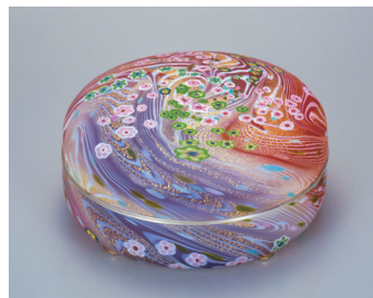
《ガラス管—花筏》 1996年 11.0 × 23.0cm 青森県立美術館寄託

千葉県に生まれた石井は、制作の場を求めて訪れた青森で、四季のうつろいと共に自然がみせる豊かな色彩と鮮やかな変化に魅了され、1991年には、青森市郊外の三内丸山に念願のアトリエ「石井ガラススタジオ青森工房」を開設。1996年に急逝するまで、青森の四季折々の自然を源泉に、新たな造形に挑み続けました。青森を制作の地に選び、その自然風土を、鮮やかで繊細な色彩と流麗で端正な造形による作品へと昇華させた石井の創作活動の軌跡を紹介します。