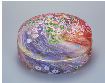
《ガラス管—花筏》 1996年 11.0 × 23.0cm 青森県立美術館寄託

千葉県に生まれた石井は、制作の場を求めて訪れた青森で、四季のうつろいと共に自然がみせる豊かな色彩と鮮やかな変化に魅了され、1991年には、青森市郊外の三内丸山に念願のアトリエ「石井ガラススタジオ青森工房」を開設。1996年に急逝するまで、青森の四季折々の自然を源泉に、新たな造形に挑み続けました。青森を制作の地に選び、その自然風土を、鮮やかで繊細な色彩と流麗で端正な造形による作品へと昇華させた石井の創作活動の軌跡を紹介します。