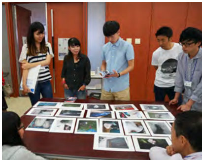
「フォトネシア沖縄写真学校」でのレクチャーの様子 2014