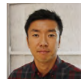
いし かわ なお き 石川直樹 (写真家)