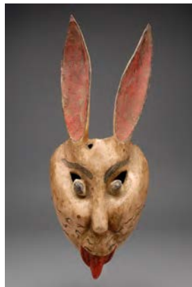
《舞踏用仮面(兎)》メキシコ合衆国 国立民族学博物館蔵