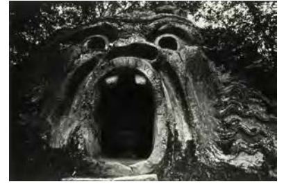
川田喜久治《地獄の入口 ヴィテルボ、イタリア》 1969 (2011)年 作家蔵