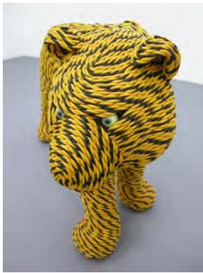
岡本光博《虎縄文》2009年 作家蔵