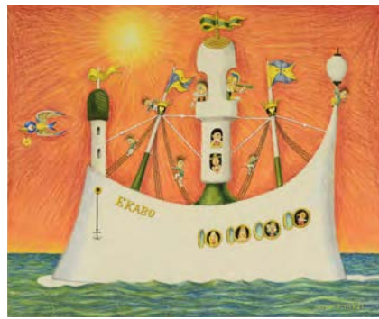
武井武雄《EKABO号》 1974年 イルフ童画館蔵