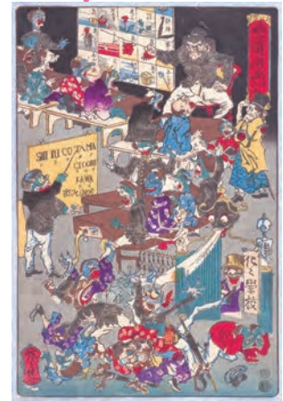
河鍋暎斎《暎斎楽画第三号 化々学校》 1874年 河鍋暎斎記念美術館蔵