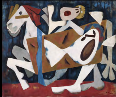
齋藤義重《あほんだらめ》(1948)

棟方志功や寺山修司、そして奈良美智。美術館には青森県ゆかりの世界に名だたるアーティストの作品が多数収められています。今回のコレクション展では、そんな中でも板材を用いて空間を大規模に再構成し、インスタレーション（空間芸術）という芸術形式の立役者として名高い齋藤義重の作品を紹介。また画家・大小島真木氏と県民の共同制作による作品や、子どもたち制作の版画作品なども取り上げ、青森の芸術風土の魅力を様々な角度から紹介します。