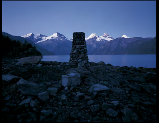
平田五郎《Inside Passage-月を盗んだワタリガラス》(2005, 07) * 寄託作品