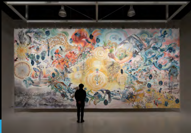
大小島真木+アグロス・アートプロジェクト《明日の収穫》(2017-18) * 寄託作品