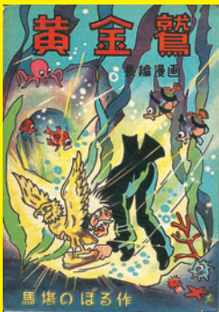
『黄金鷲』 1948年 昭文社

そのほか、会場で自由に参加できるワークショップなど様々な関連イベントを開催予定。詳しくは青森県立美術館HPを随時ご覧ください。