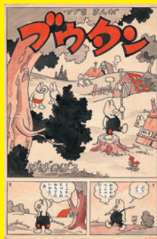
『ブウタン』 原画 1954年