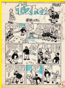
『ポストくん』 原画 1950年