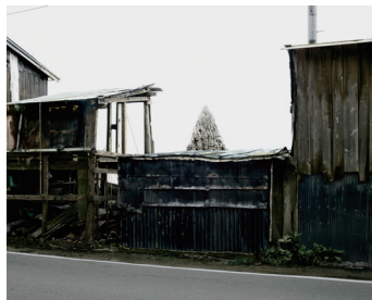
北島敬三「UNTITLED RECORDS」より 〈青森県外ヶ浜町〉、2011年、顔料印刷 ©KITAJIMA KEIZO

日本を代表する写真家・北島敬三、韓国・チェジュ島出身で現代美術の最前線で活躍するコ・スンウク、国際的に活躍する沖縄出身の映像作家・山城知佳子、そして八戸市出身で2019年に亡くなった演出家・豊島重之。4人のアーティストの写真や映像が、展示室にともす「あかし」を通じて、災厄をのりこえ、共に生きるための世界を照らし出します。本展はゲスト・キュレーターとして李静和氏(政治思想)、倉石信乃氏(詩人・写真批評)を迎えた共同キュレーションによる企画です。