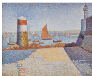
ホール・シニャック《ポルトリユー、グールグロ》1868年

東奥日報創刊130周年と青森放送創立65周年を記念する本展は、ひろしま美術館が所蔵するモネ、ルノワール、ドガなどの印象派やエコール・ド・パリの作品群といったフランス美術の名品に、浅井忠や黒田清輝などの洋画、横山大観や上村松園などの日本画を展示し、時代や場所を越えて輝き続ける美を鑑賞する機会とします。