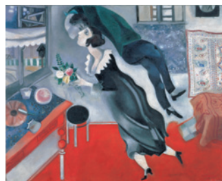
マルク・シャガール《誕生日》1923年 AOKIホールディングス蔵

マルク・シャガールの三次元の世界を紹介する日本で初めての展覧会。戦後のシャガールは陶磁器や彫刻なども手がけています。本展では画家の初期の絵画作品から三次元的な制作への関心をたどり、後期の彫刻や陶磁器など、あまり知られていない立体的な作品群を紹介します。