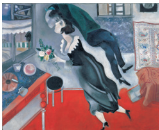
マルク・シャガール《誕生日》1923年 AOKIホールディングス蔵

マルク・シャガールの三次元の世界を紹介する日本で初めての展覧会。戦後のシャガールは陶磁器や彫刻なども手がけています。本展では画家の初期の絵画作品から三次元的な制作への関心をたどり、後期の彫刻や陶磁器など、あまり知られていない立体的な作品群を紹介します。