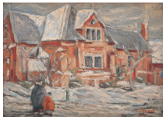
横方志功《雪国風景図》 1924年 油彩・板 青森県立美術館蔵

西洋文明の歴史と伝統に深く根ざした技法に挑んだ作家たちによって、日本と青森の洋画はどのように築かれていったのか。茨城県近代美術館、栃木県立美術館のコレクションによる日本近代洋画の充実した作品群とともに、青森県内の美術館・博物館等が所蔵する郷土作家たちの貴重な作品を集め、100点を超える充実した展示で、一世紀以上に及ぶ画家たちの夢と冒険の軌跡を紹介する。日本の洋画の原点ともいえるフランス近代洋画4点も特別展示。