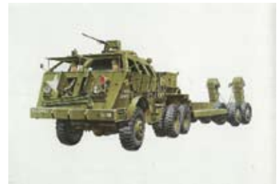
タミヤ 1/35 「アメリカ40トン戦車運搬車ドラゴンワゴン」 1998年 画：江間浩司