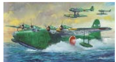
ハセガワ 1/72 「二式大艦」 1966年 画：六車弘