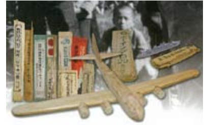
戦中の飛行機模型

本セッションでは、昭和初期から戦中にかけて流行した飛行機模型や一般に広く浸透していた戦争のイメージを各種資料によって紹介し、当時の大衆文化の諸相を検証するとともに、戦後になって模型が「教材」から「ホビー」へと変化していく過程を様々な教材模型やソリッドモデルで振り返ります。