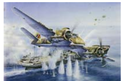
タミヤ 1/48 「ブリistol・ボーファイター-MK. II」 1997年 画：G.OLIVEREAU