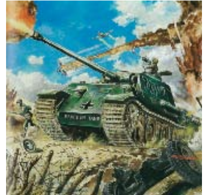
タミヤ 1/35 「ドイツ パンサータンク」 1961年 画：小松崎茂

この時代のパッケージを飾ったボックスアートは、それまでの商品名のみが大きく記されたエアプレーンやソリッドモデル等のパッケージとは大きく異なり、新しい時代の新しいホビーにふさわしいものが模索されました。世は「戦記」ブームの只中。タミヤは雑誌の挿絵等で活躍していた人気イラストレーター小松崎茂をいち早く起用し、昭和36（1961）年に発売された1/35「ドイツ パンサータンク」で大きな話題を集めると、他のメーカーも一気に追従。受容層の感情を刺激し、無限の想像力を喚起する「情景」を描くというボックスアートの様式が瞬く間に確立されていくことになります。