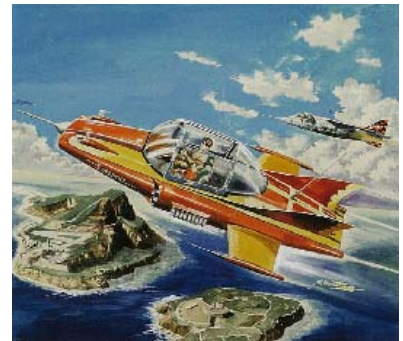
タミヤ「スーパーカー」1962年 画：小松崎茂

そして昭和55（1980）年に「機動戦士ガンダム」のプラモデルがバンダイから発売。翌年の映画版公開とともに空前のブームとなる「ガンブラ」は、架空のモチーフでありながら縮尺が表示されるなど、明らかに従来のものとは異なるスケールキット的なアプローチで開発されたものでした。それまでのキャラクターモデルの印象を大きく変えた「ガンブラ」の方向性は他メーカーにも大きな影響を与え、昭和58（1983）年をピークに第二次ブームが起こり、新製品が次々と市場を賑わせていくようになります。そして、新しい技術が投入され進化を続ける「ガンブラ」を筆頭として、キャラクターモデルは今や一大市場を形成するに至っています。