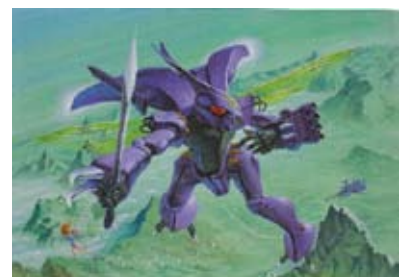
バンダイ 1/72「ダンバイン」1983年 画：開田裕治