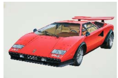
タミヤ 1/24 「ランボルギーニ・カウンタック LP500S」 1978年 画：島村英二