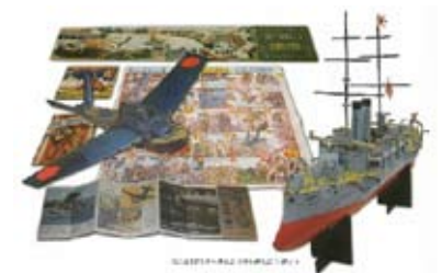
講談社発行「少年倶楽部」「幼年倶楽部」付録より