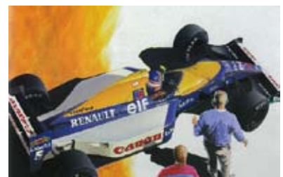
ハセガワ 1/24 「ウィリアムズFW14B」 1992年 画：和田隆良