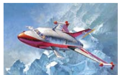
ハセガワ 1/72「ジェットビートル」2003年 画：小池繁夫