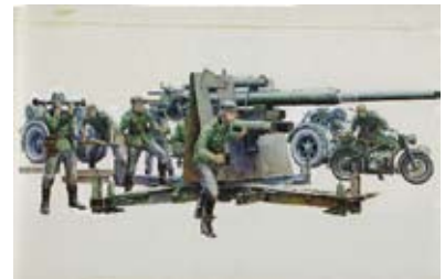
タミヤ 1/35 「ドイツ 88mm 砲 Flak 36/37」 1972年 画：大西将美