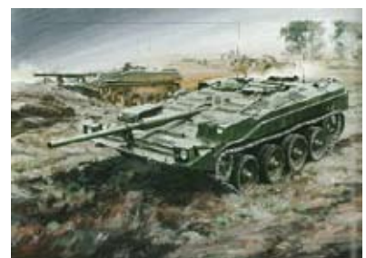
タミヤ 1/48 「スウェーデン「S」バルカン新鋭戦車」 1969年 画：高荷義之