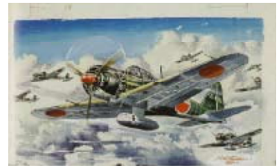
タミヤ 1/50 「日本海軍零式艦上戦闘機 52型」 1963年 画：小松崎茂