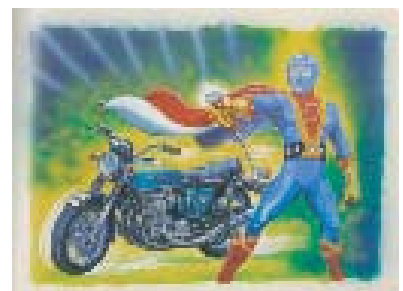
アオシマ「光の戦士ダイヤモンド・アイ サンダー号」1973年 画：根元アートセンター