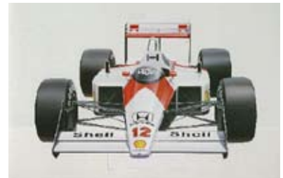
タミヤ 1/20 「マクラーレン MP4/4」 1988年 画：川上泰弘