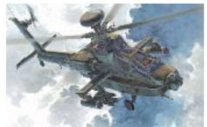
ハセガワ 1/48 「AH-64D アパッチロングボウ」 2001年 画：小池繁夫