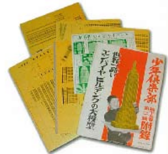
講談社発行「少年倶楽部」「幼年倶楽部」付録より