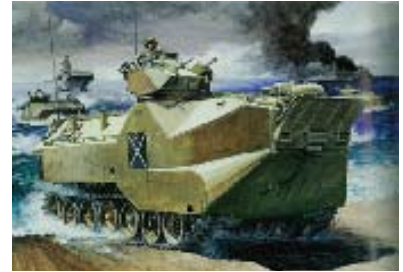
タミヤ 1/35 「アメリカ強襲水陸両用兵車 AAVP7A1 アップガン シードラゴン」 1992年 画：高荷義之

この時期のボックスアートもまた時代性を反映して、コンピュータグラフィックス（CG）による描写が多くなってきました。夢や物語を紡ぎ出すための素材であったプラモデルが、需要層の果てしのない欲望を投影する「装置」へと変化した時、ボックスアートもまた想像力を刺激する劇的なものから、CGが得意とするモチーフの精密描写へと移り変わってきたと言えはしないでしょうか。