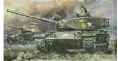
タミヤ 1/35 「アメリカ M60A1 シャイアン戦車」 1970年 画：高荷義之

一方で、1970年代の後半にはスーパーカー・ブームが起こり、各メーカーは競ってカーモデルを開発。ほぼ同時期にアニメ・ブームも発生し、1980年代初頭にはSFキャラクターモデルが次々に商品化されるなど、プラモデルの対象が「大人向け」と「子ども向け」とに大きく二極化していったこともこの時代の大きな特徴と言えるでしょう。