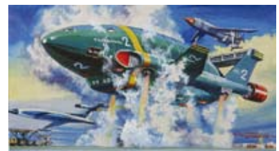
イマイ「パーズル人形付サンダーバードTB2号」1971年 画：小松崎茂