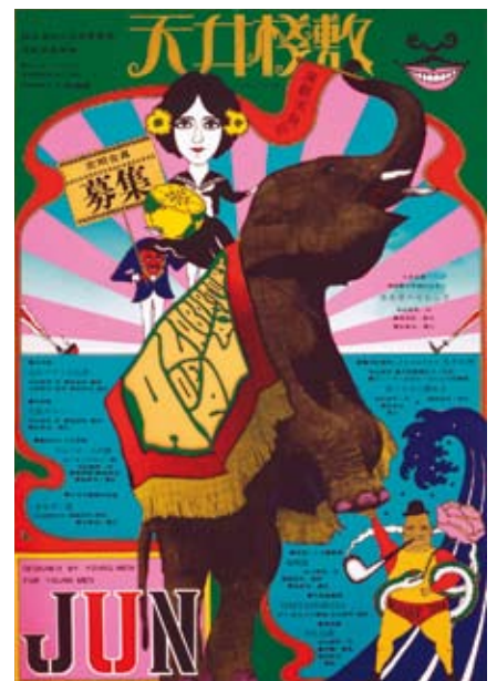
「天井桟敷定期会員募集」ポスター 宣伝美術：横尾忠則 1967年