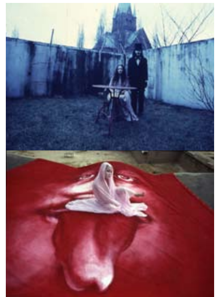
寺山修司幻想写真