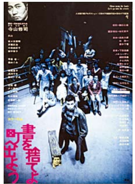
左：映画「田園に死す」1974年 資料提供：人力飛行機舎 右：映画「書を捨てよ町へ出よう」デザイン：榎本了亮ポスター 1971年 資料提供：人力飛行機舎