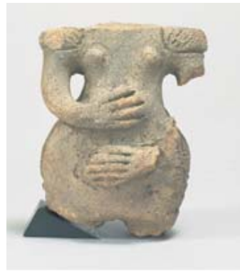
「土偶」長野県 尖石縄文考古館蔵

生の喜び、死や超越的なものに対する恐怖、根源的な欲望など、いつの時代も変わることのない人間の普遍的な意識を写した縄文遺物と現代の表現をそれぞれ比較し、時代を超えた人間としての意識の共通性を探ります。