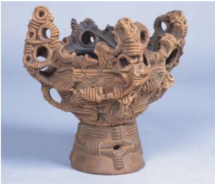
「台付鉢形土器」(塩尻市上木戸遺跡)長野県立歴史館蔵