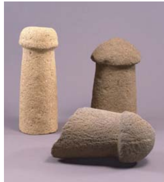
「石棒」長野県富士見町大花遺跡 井戸尻考古館蔵 ※写真のうち2点を展示予定

生産性や生命の循環を象徴する縄文の石棒と、同様の意図を持つ現代の表現を同時に展示することで、未来を指向するエネルギーに満ちた空間を作り上げ、展示会の最終章として、新しい時代を切りひらく豊かな力を来館者に体感してもらいます。