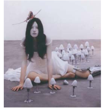
小谷元彦「エレクトラ（クララ）」 高橋コレクション蔵 ©ODANI Motohiko Photo by KIOKU Keizo courtesy YAMAMOTO GENDAI, Tokyo