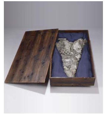
荒川修作「作品」 青森県立美術館蔵