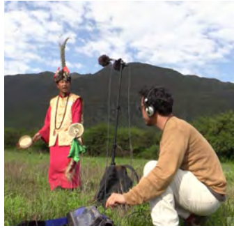
雲南省で宗教能力者トンバのレコーディング